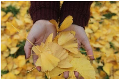
Laboratorio di fotografia