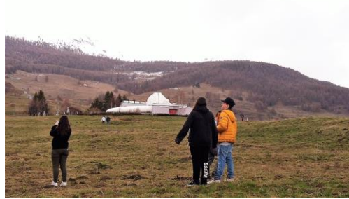
Gita all'osservatorio astronomico di Aosta

La segreteria è situata presso la sede di via Giacosa 46, Padiglione Quaroni Orario apertura uffici al pubblico :