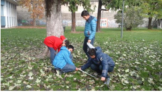
Misure nel parco

Proposte rivolte alle famiglie ed ai ragazzi, condivise e co-progettate con altri soggetti presenti sul territorio, per ampliare l'offerta formativa in orario extrascolastico: